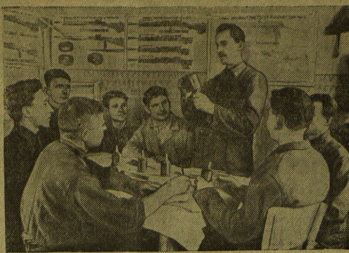
ЛВВОВ. На механическом заводе создана первичная организация добровольного общества содействия Армии. На снимке: группа членов общества за изучением ручной гранаты.

Вас. Крикунов, кандидат исторических наук.