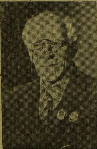
К. С. Станиславский.

Первый занавес поднялся в новом театре 14 октября 1898 г. (по старому стилю). Шла трагедия А. К. Толстого «Царь Федор Иоаннович». Игра всех артистов была проникнута искренностью, простотой, правдой жизни. Эта правда подкреплялась и декорациями. Терема, дворцовые покои, костюмы, домашняя обстановка — все на сцене показывало реально боярскую Русь конца XVI века. Зрители убедились не только в талантливой игре актеров, таких, как Москвин, Книппер и других, но и в стремлении театра показать правду